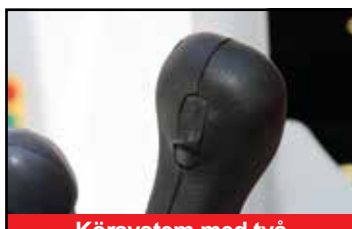
Körssystem med två hastigheter/automatisk växling