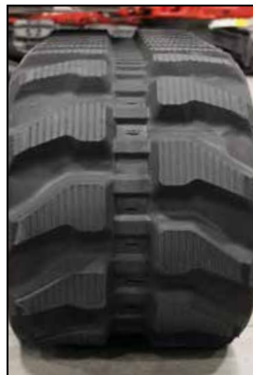
Alternativa lärband – gummi eller stål