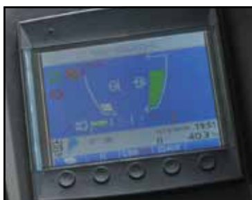
Display i version med hytt