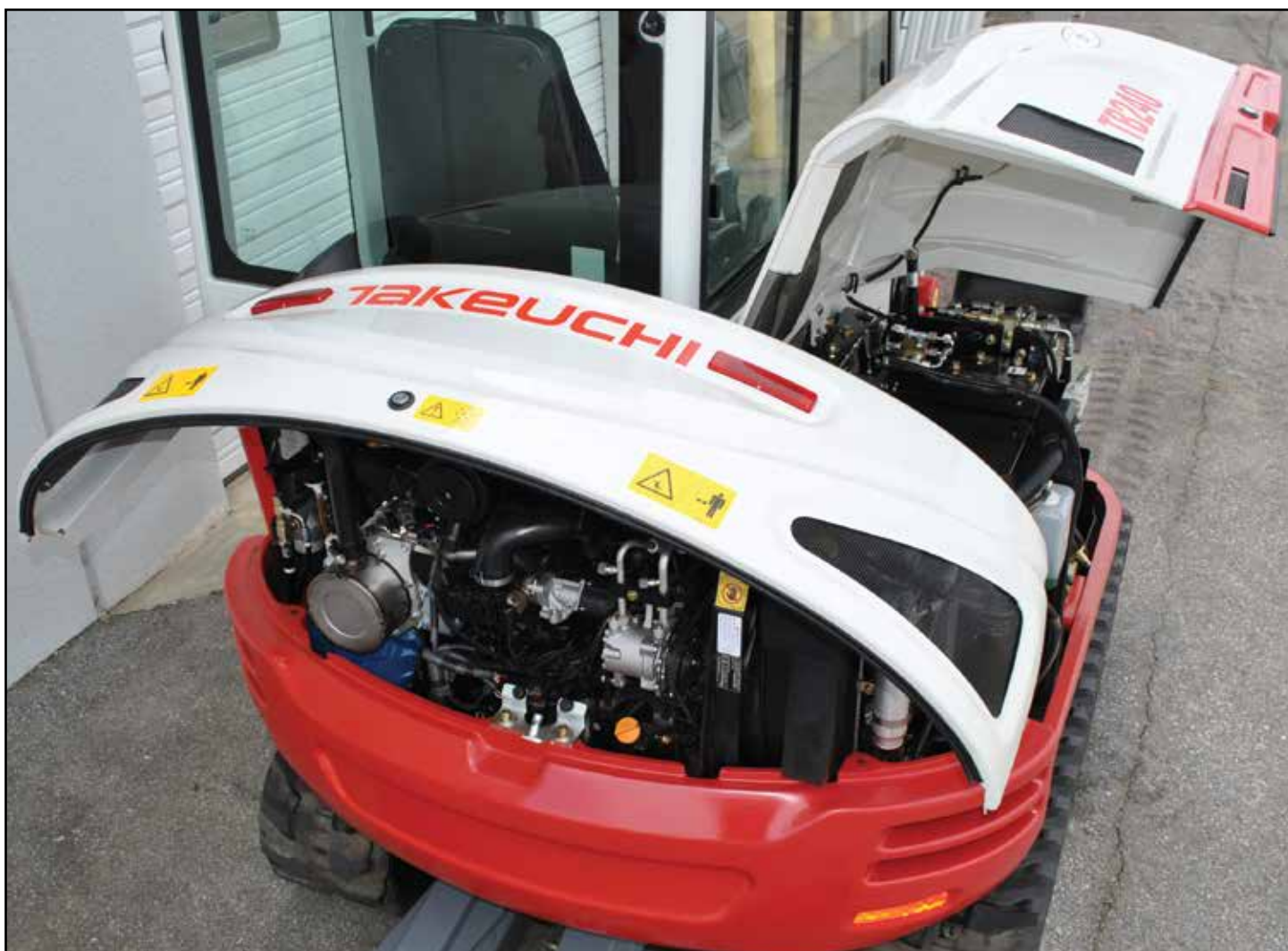
Stora, låsbara servicehuvar ger vandalskydd och enkel åtkomst för service och underhåll

Maskinen har en interiör med hög förarkomfort och pilotstyrda reglage, körreglage med stora pedaler samt fotmanövrerad bomsväng, lättåtkomliga vippbrytare och gasreglage i form av ett vred.