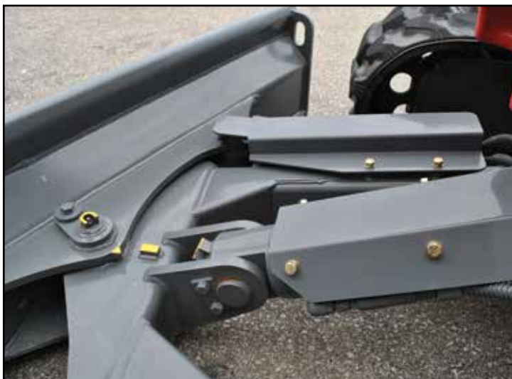
Diagonalblad som tillval med vändbar, skruvmonterad skärkant