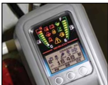
Display i version med skyddstak